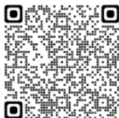
Figura 1 QR CODE_Whistleblowing: il sistema di segnalazioni interno - Gruppo Acea